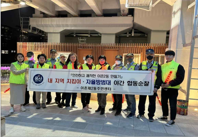
용산구 내지역지킴이 야간순찰