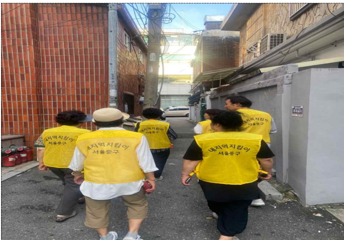
중구 내지역지킴이 주민순찰