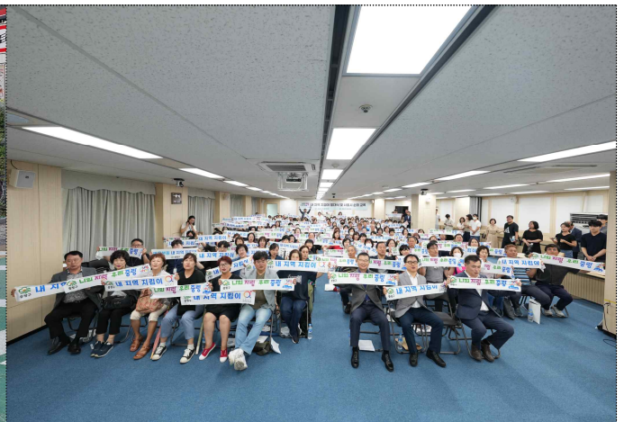
중랑구 내지역지킴이 발대식 사진