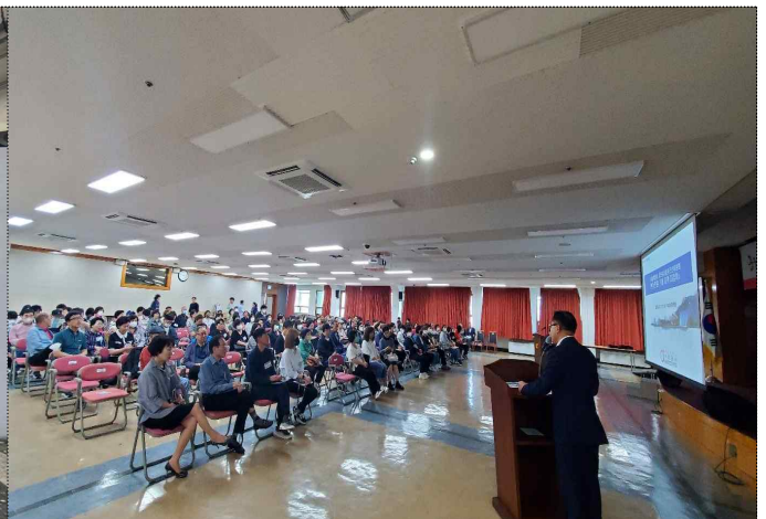
중구 내지역지킴이 순회교육