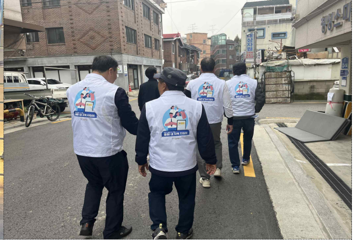
강서구 내지역지킴이 주민순찰