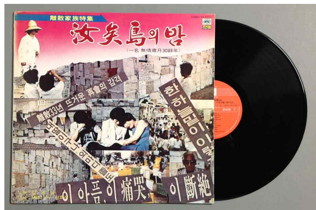
KBS 특별생방송 '이산가족을 찾습니다' 기념 음반