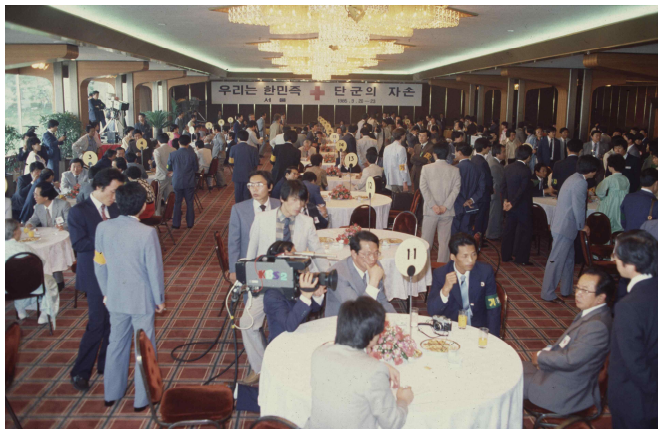
1985년 남북한 고향 방문 및 예술공연단 교환 방문