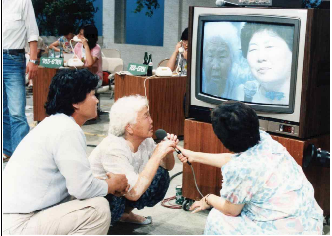
KBS 특별생방송 '이산가족을 찾습니다' 이산가족 상봉 장면