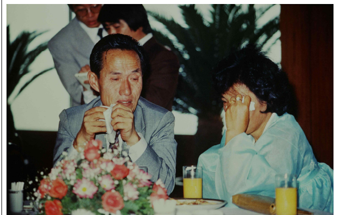
1985년 남북한 고향 방문 및 예술공연단 교환 방문