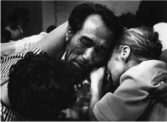
KBS 특별생방송 '이산가족을 찾습니다' 이산가족 상봉 장면