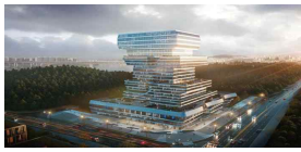
서울 유니콘 창업허브