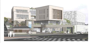
홍익 R&D 지원센터