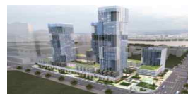
여의도 통합 핀테크랩