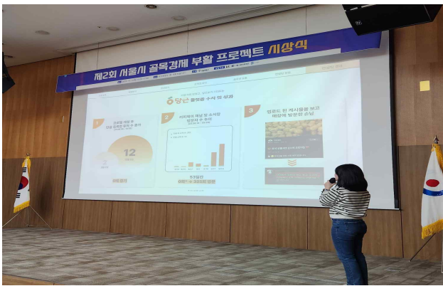
① 우수사례 발표 1_눔룬눔룬팀(대상)