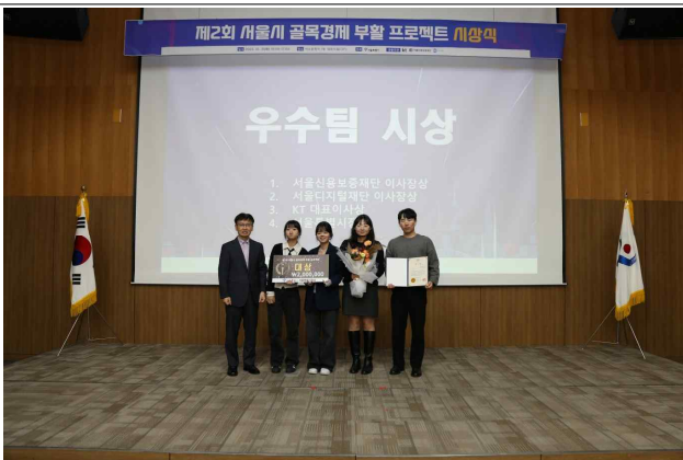
③ 시상식 현장 1_어닝소프라이즈팀(대상)