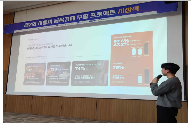
② 우수사례 발표 2_어닝소프라이즈팀(대상)