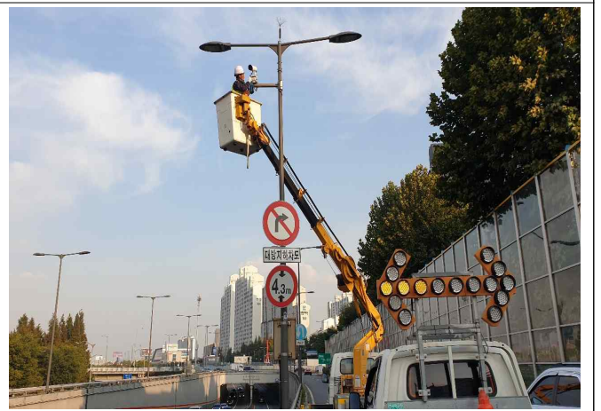
〈영상검지 카메라 세척〉