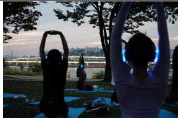
나홀로요가 (2022 한강페스티벌_가을)