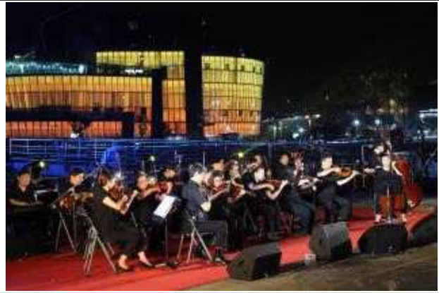
헤질녘가을음악회 (2017 명작영화OST콘서트)