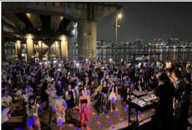
한강무소음DJ파티 (2023 한강페스티벌_여름)