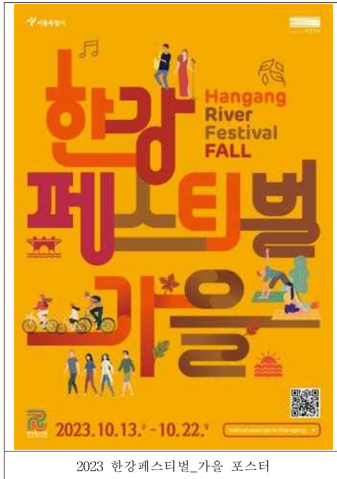
2023 한강페스티벌_가을 포스터