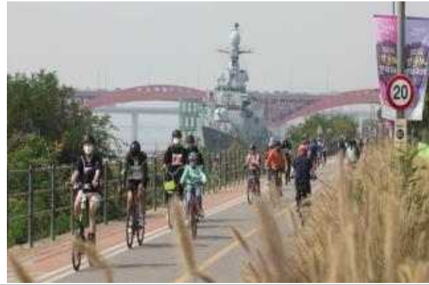
한강슬로우라이딩 (2022 한강페스티벌_가을)