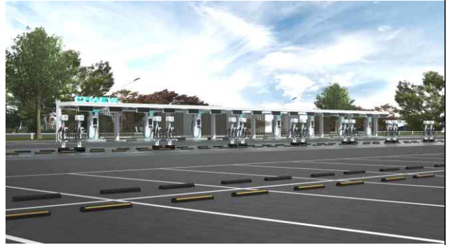
전기차 충전기 설치 조감도(월드컵공원)