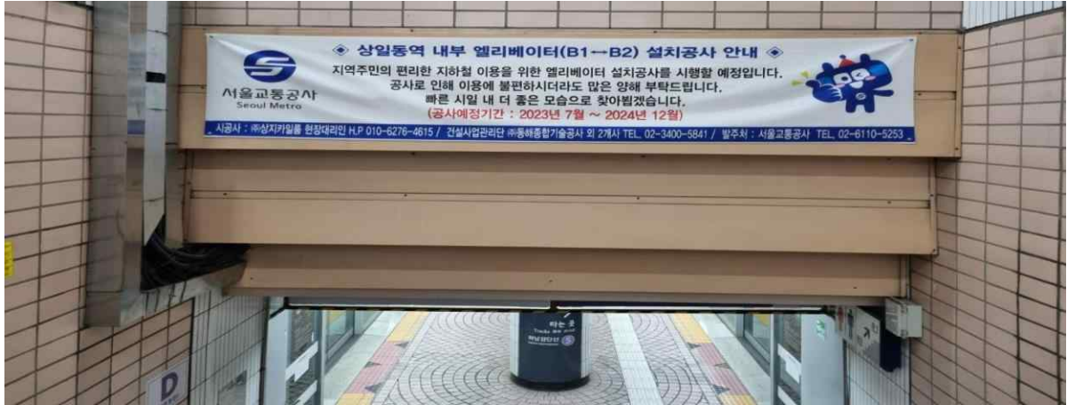
상일동역 내부 엘리베이터 공사 안내 관련 현수막