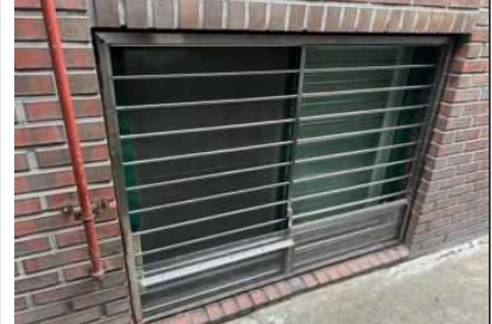
방범창 + 물막이판 일체형