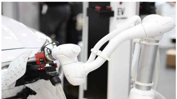
무인로봇충전기 전시 사진