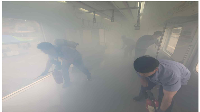
화재 발생 시 응급조치