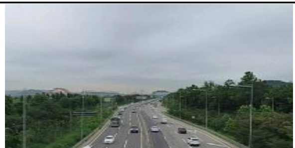
올림픽대로 가로등 설치 전경