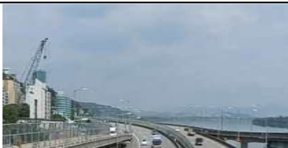
강변북로 가로등 설치 전경

○ 저효율 고용량의 방전등을 고효율 저용량의 LED광원으로 교체 ⇨ 전력료 절감