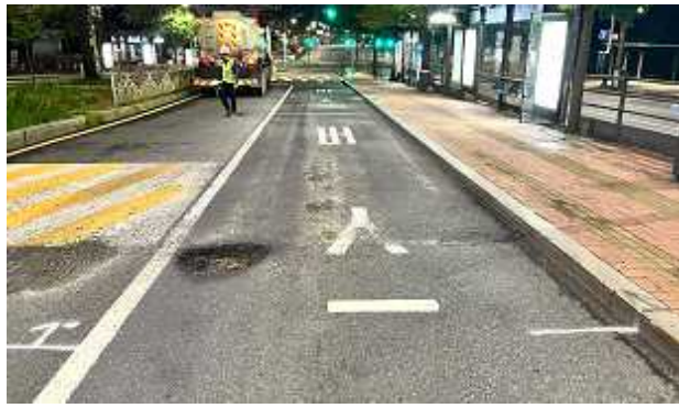
< 성산로 연세대앞 버스정류장 >(보수전)