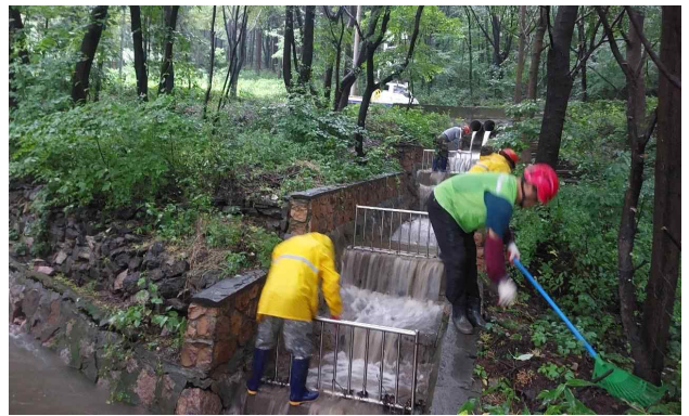
< 산지 배수로 정비 >