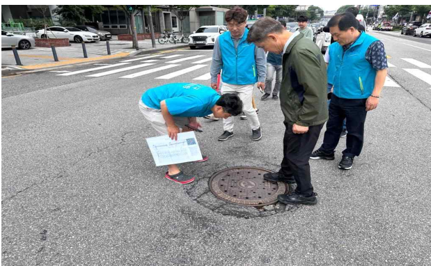
< 하수시설 점검 >