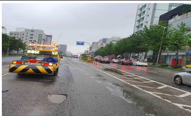
< 공항대로 557 >(보수전)