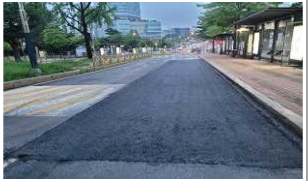
< 성산로 연세대앞 버스정류장 >(항구 보수후)