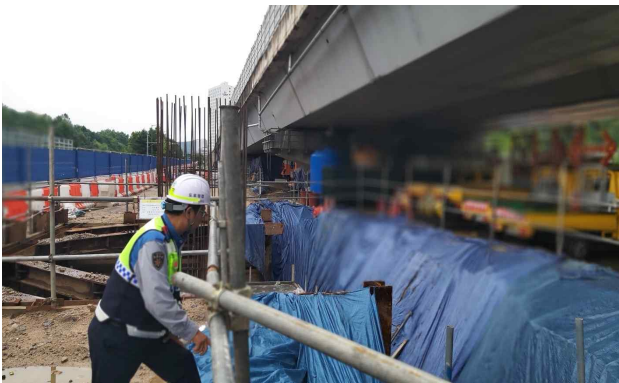
< 공사현장 점검 >