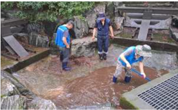
< 산지 사방시설 낙엽 정비 >