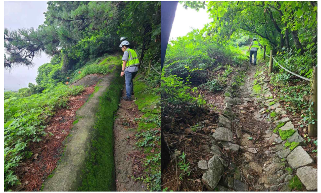
< 산지 사면 배수로 점검 >