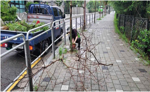
< 고사목 제거 >