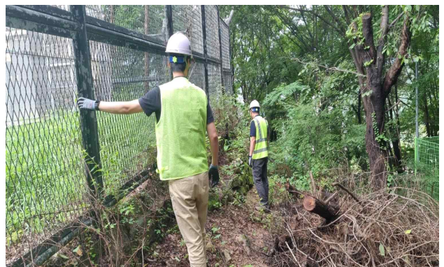
< 배수지 시설 점검 >