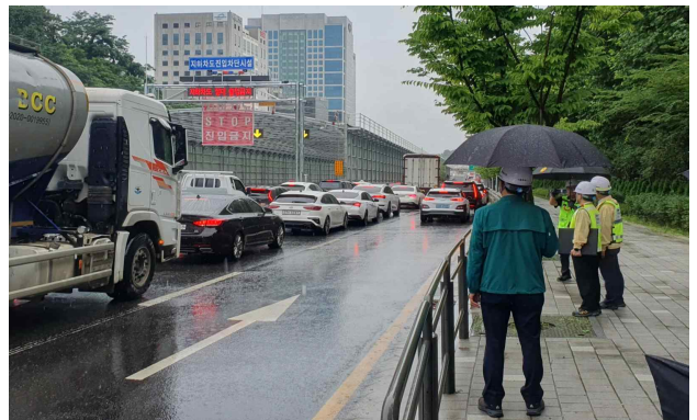
< 지하차도 진입차단설비 점검 >