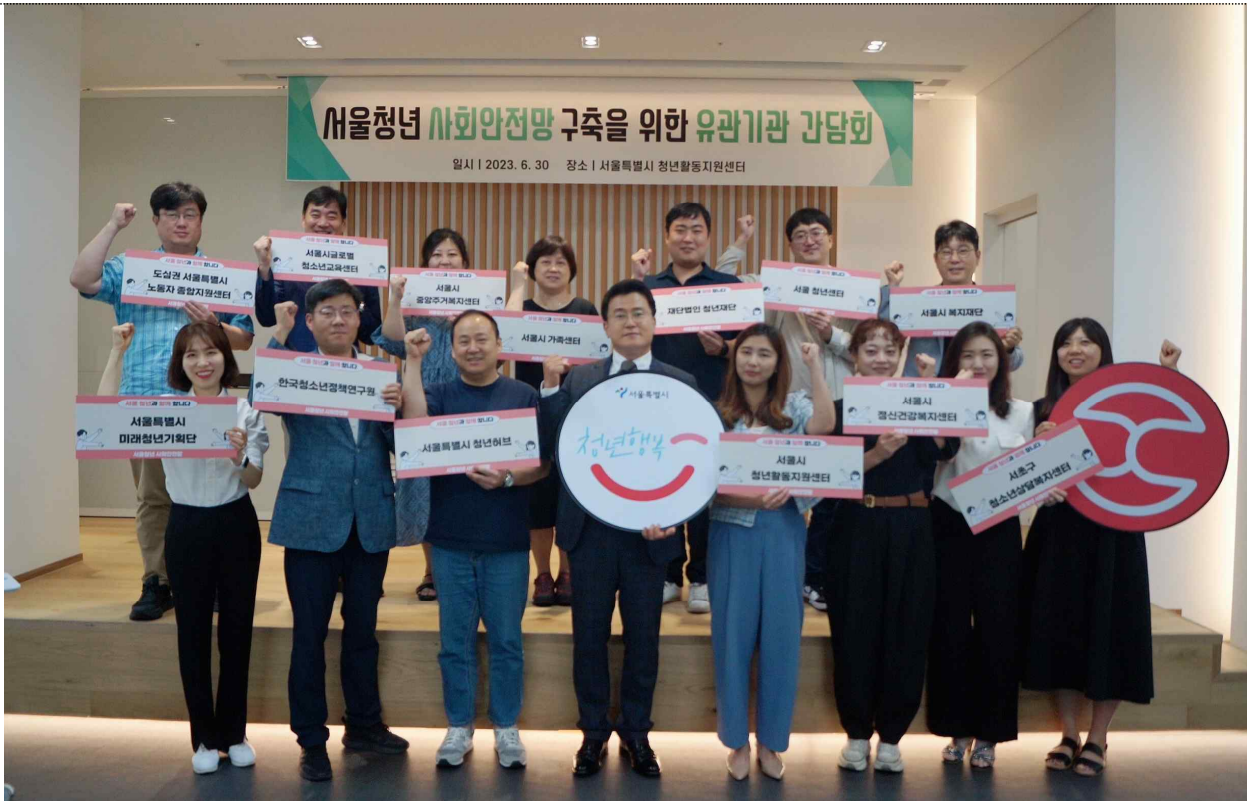
서울 청년 사회안전망 구축 협의체 출범식('23.6.30, 청년활동지원센터)