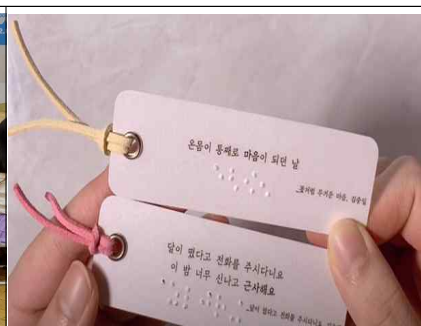
점자책갈피 만들기 예시