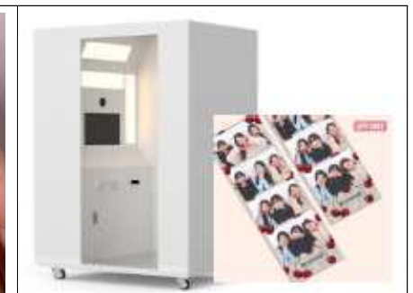
동행네컷 사진기 예시