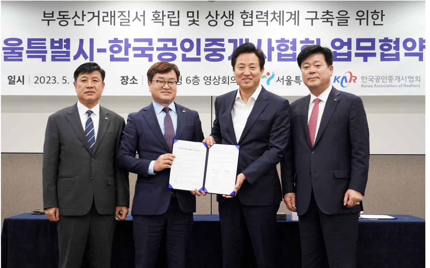
사진설명: (좌측부터) 김용혁 한국공인중개사협회 서울남부지부장, 이종혁 한국공인중개사협회장, 오세훈 서울시장, 김종호 한국공인중개사협회 서울북부지부장