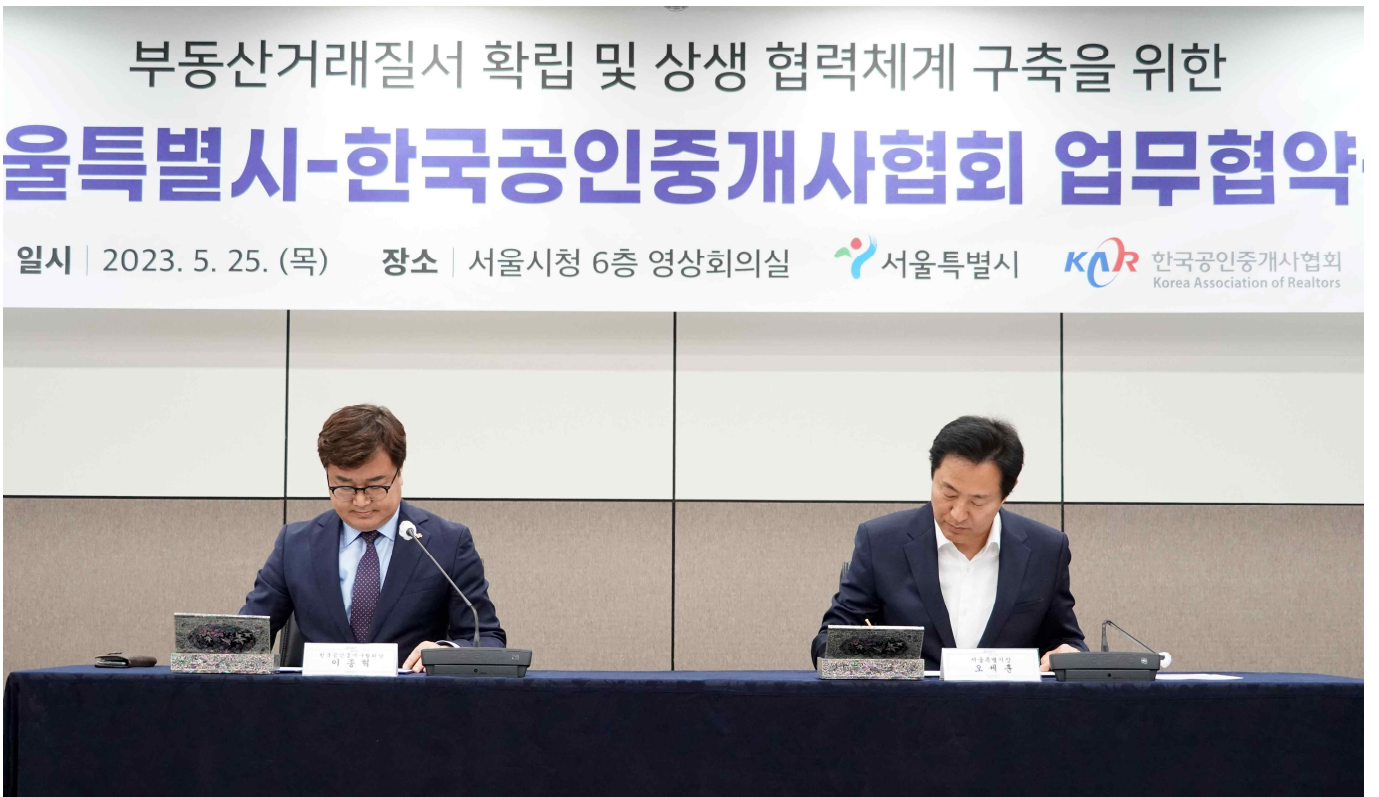
사진설명: 서울특별시와 한국공인중개사협회 협약식 체결 모습