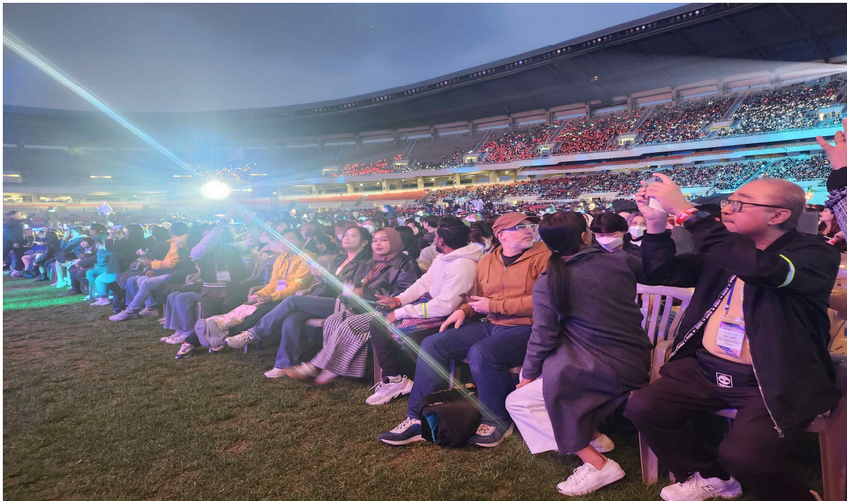
(사진2) '서울 페스타 2023' 개막식에 참가하여 현장의 뜨거운 분위기에 놀라고있는 참가자들