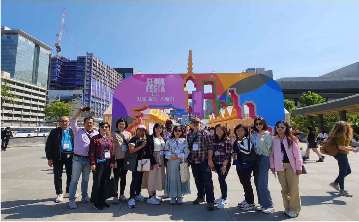
(사진3) '서울페스타 2023' 부대행사 광화문광장 '서울컬처스퀘어'를 구경하는 참가자들