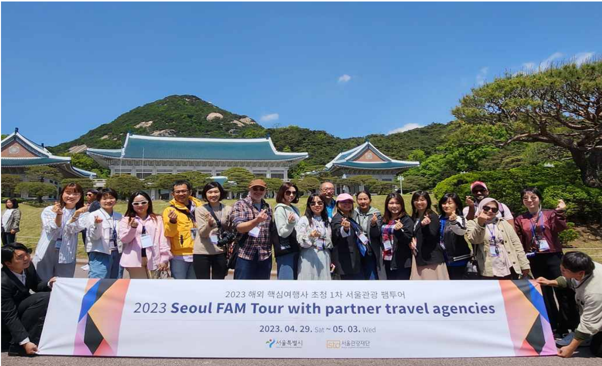
(사진1) 서울 신규 관광자원 청와대를 방문한 팸투어 참가자들