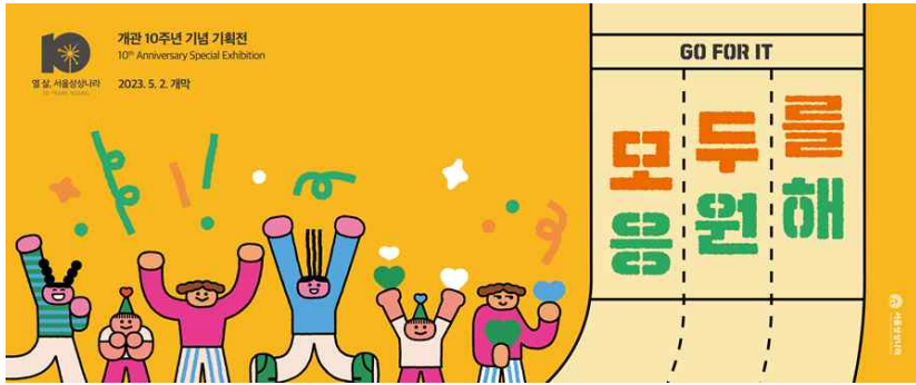
전시 홍보 배너