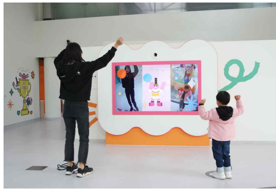
전시 체험 - 4