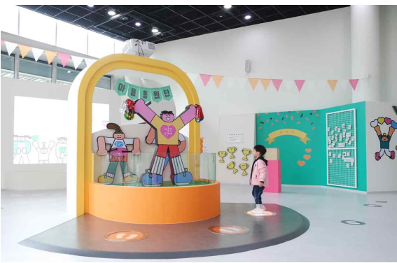
전시 체험 - 1