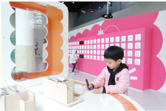
전시 체험 - 3