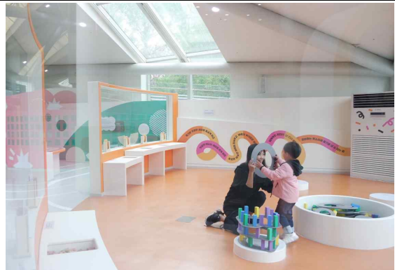
전시 체험 - 2