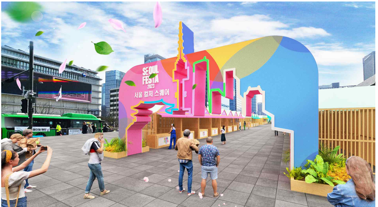
<서울 컬처스퀘어 북측 입구>