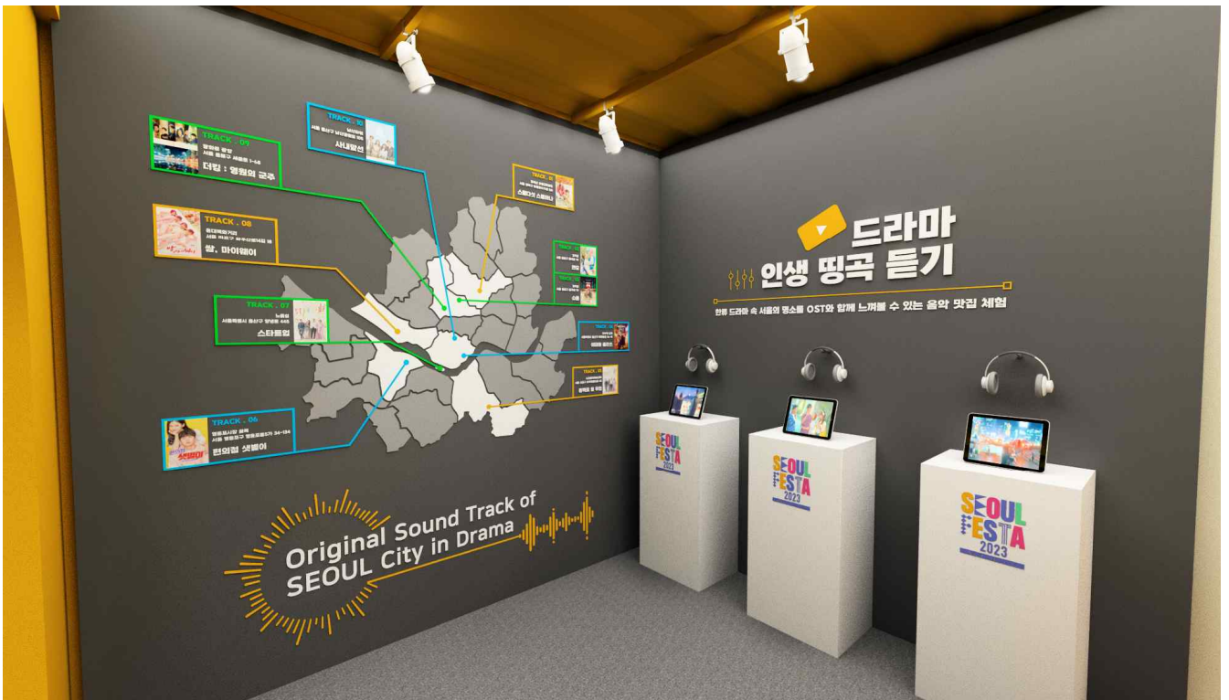
<관광홍보존 내 인생핑크듣기>