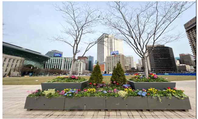
서울광장 봄꽃 식재 사진