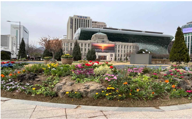
서울광장 봄꽃 식재 사진