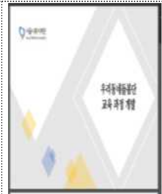
우리동네돌봄단 교육과정 개발