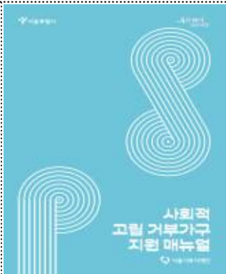
사회적 고립 거부가구 지원 매뉴얼