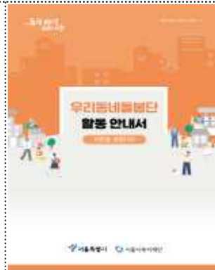
우리동네돌봄단 활동 매뉴얼