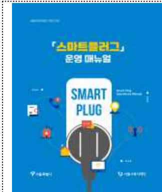
스마트플러그 운영 매뉴얼