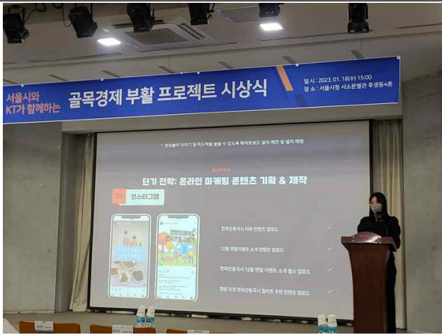
① 우수사례 발표 1_같이가게팀