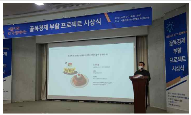
④ 우수사례 발표 4_와그작팀