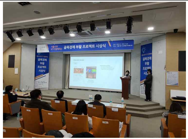
② 우수사례 발표 2_젠틀몬스터팀