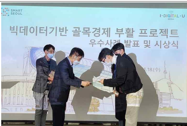
⑤ 시상식 현장 1_엘리시아팀(대상)