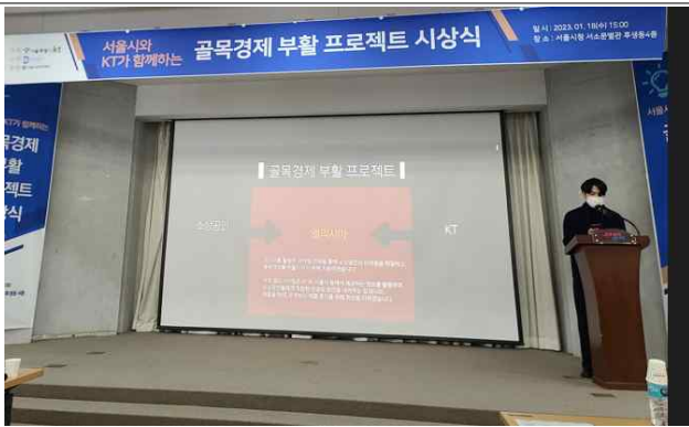
③ 우수사례 발표 3_엘리시아팀