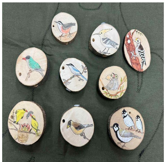
월드컵공원 겨울방학 특별 프로그램 겨울철새 나무메달 드로잉