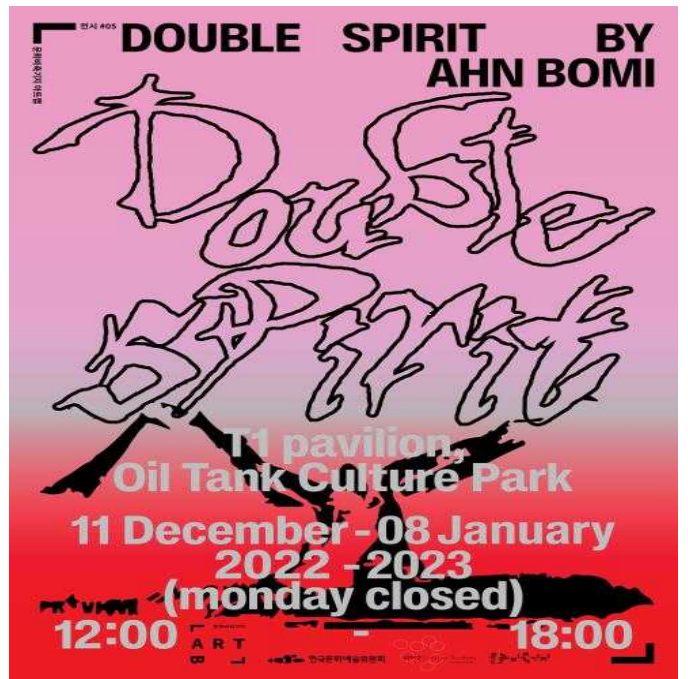
문화비축기지 T1 전시<더블 스피릿>