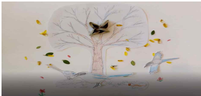
월드컵공원 겨울방학 특별 프로그램 '에코 애니메이션'