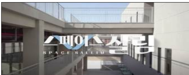
< 스페이스 살림 측면 >