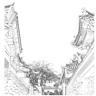
체험 - 북촌사계(北村四季) 채색노트(2)