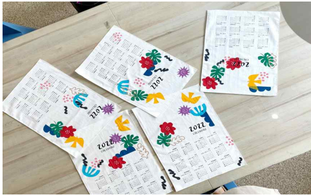
체험 - 동지책력(冬至冊曆), 달력만들기