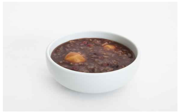
나눔 - 동지시식(冬至時食) 팔죽나눔