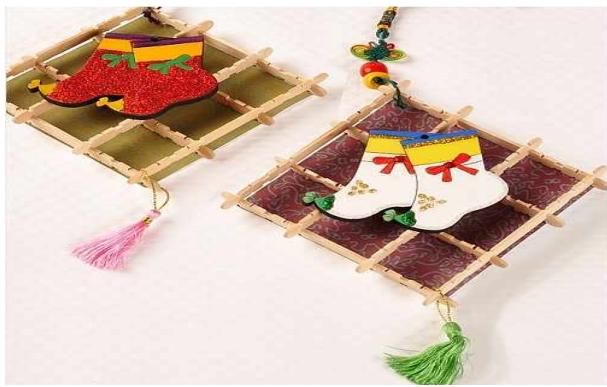
체험 - 버선걸이 만들기