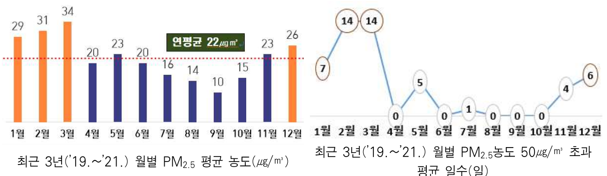
【 최근 3년간의 초미세먼지 고농도 발생 추이 】