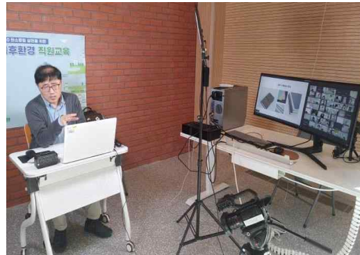
< 서대문구 기후환경 직원교육(온라인) >