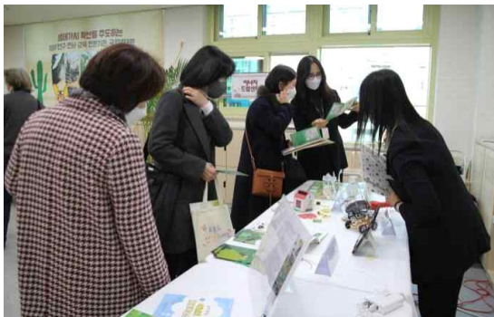
&lt; 염리초 생태전환축제 &gt;