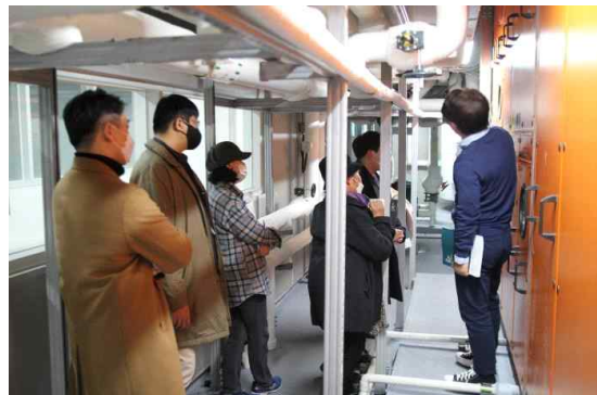
< 제로에너지 스킬업 교육 >