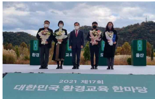
&lt; 대한민국 환경교육 한마당 &gt;