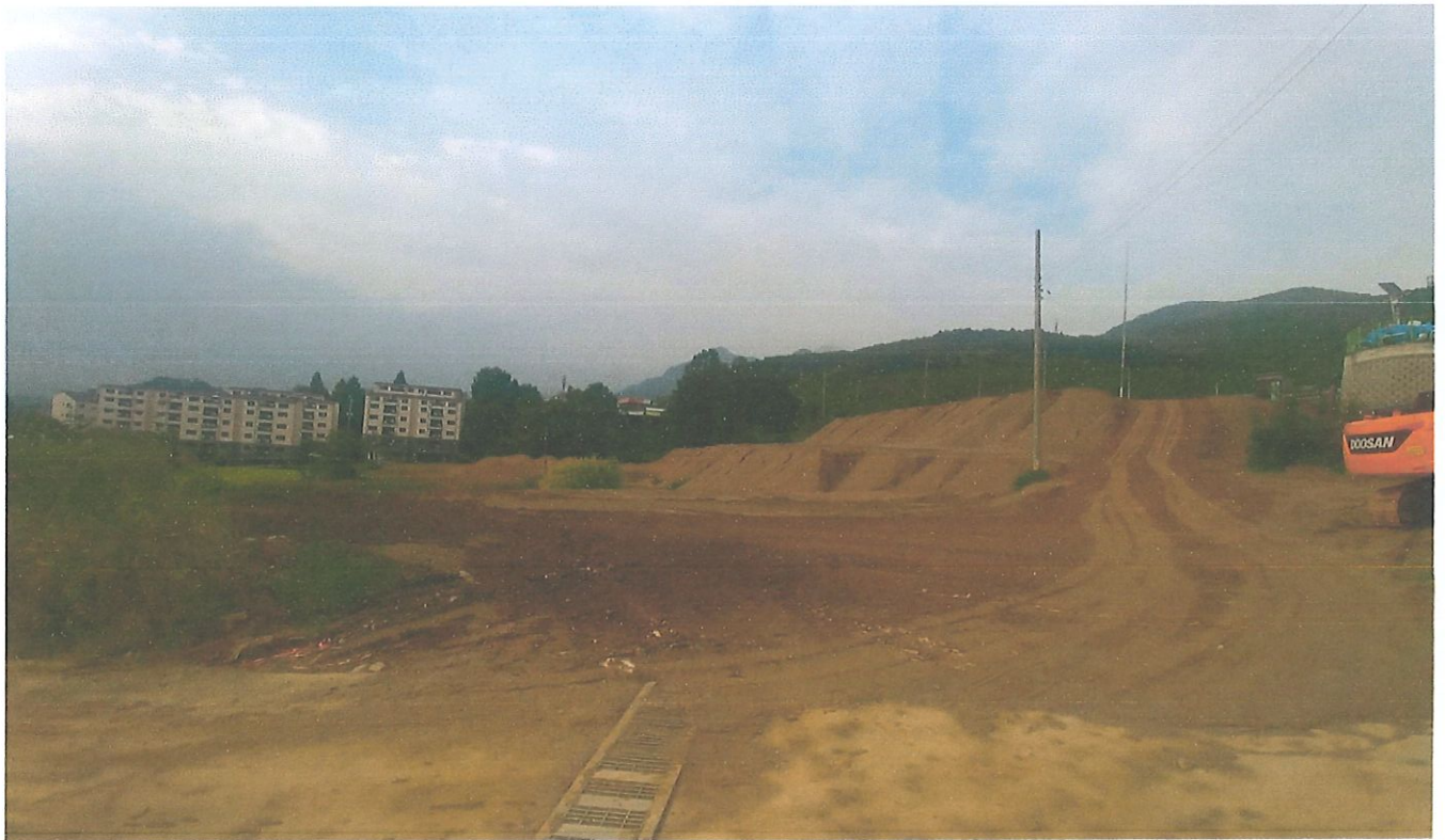
현장 전경(양평군 양평읍 백안리 247-1)