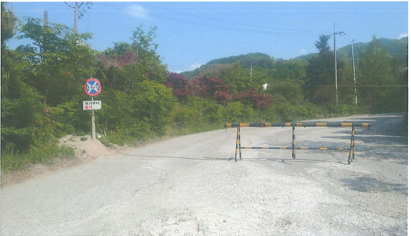
현장 전경(공사장 입구)