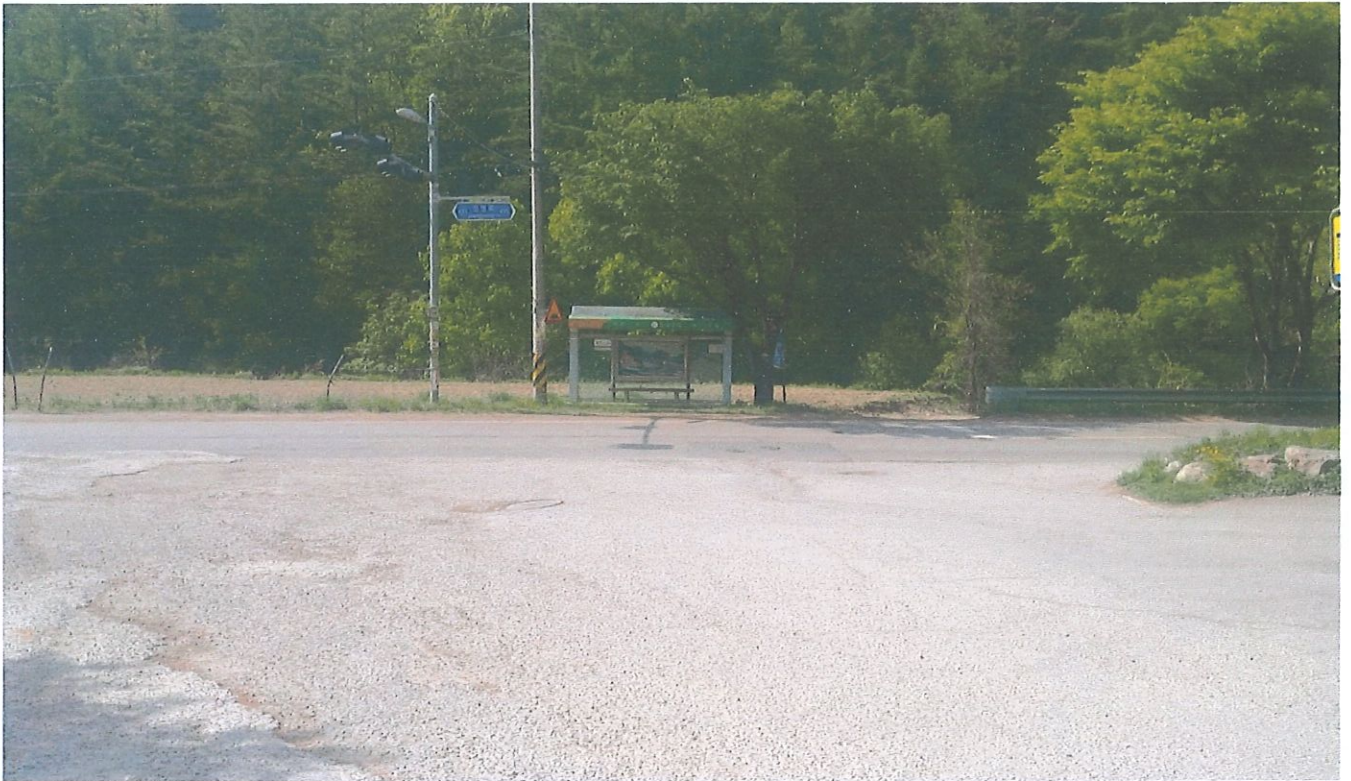
현장 전경(퇴촌면 도수리 삼거리)