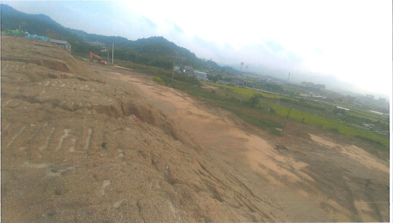
현장 전경(양평군 양평읍 백안리 247-1)