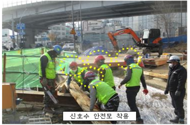
신호수 안전모 착용