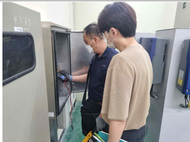
출력전류 및 과부하 여부 측정