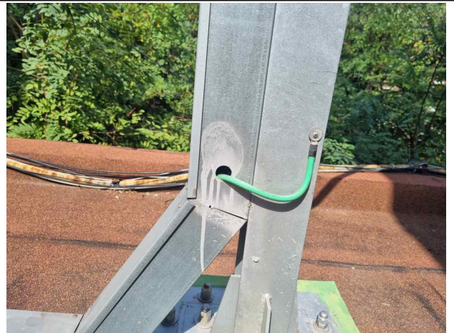
접지 상태 점검