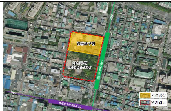
① 영등포구청 일대