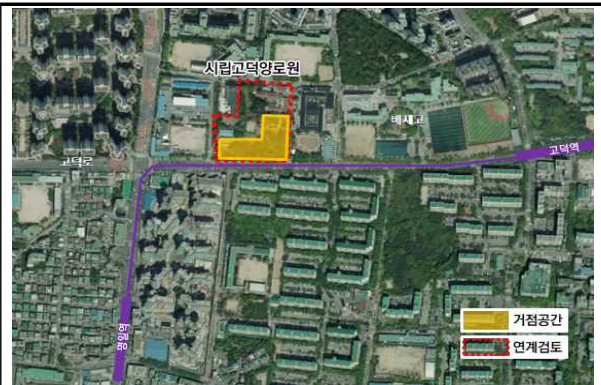
② 시립고덕양로원 일대