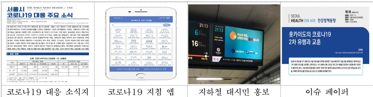
코로나19 대응 소식지

* 한국교육학술정보원 등재(1,211회 다운), 언론보도(90회), 재단 홈페이지 및 SNS를 통한 제공