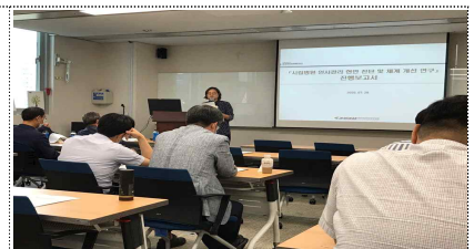
시립병원 관계자 회의