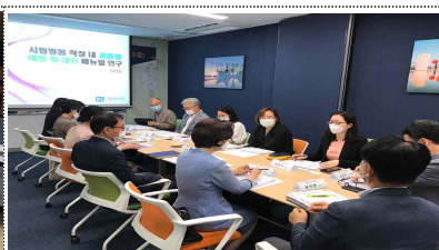
직장내 괴롭힘 관련 연구회의