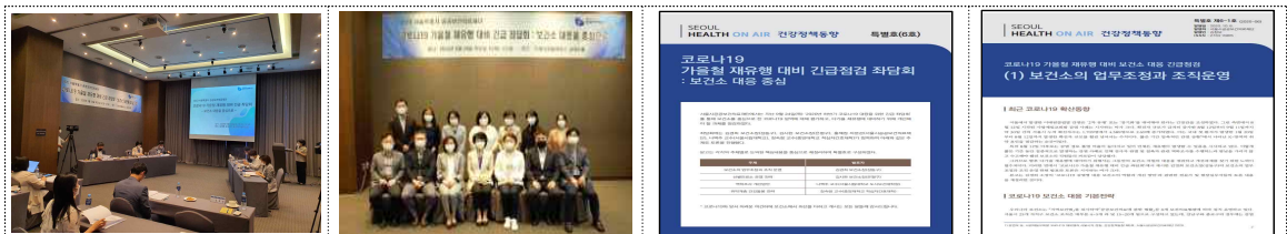
코로나19 가을철 재유행 대비 긴급 좌담회