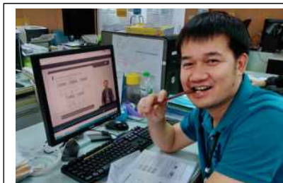
방콕시 공무원 HRD과정 온라인연수