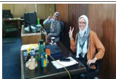
카이로 공무원 스마트시티과정 온라인연수