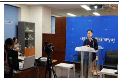
국제연수 전문가 화상세미나