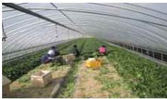
【 생산 】