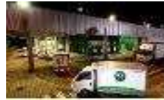
【 출고·배송 】