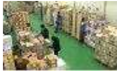
【 입고(검품) 】