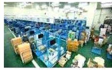
【 학교별 분류 】