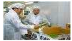
【 학교검수검품 】