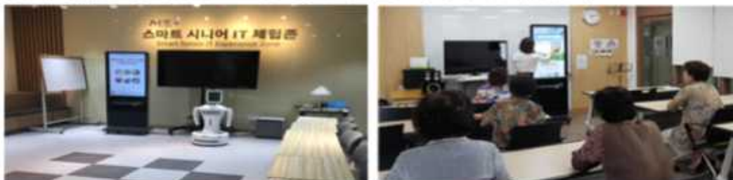
▶ 키오스크 메뉴 : 패스트푸드·카페 음료 주문, 영화티켓 발권, 고속버스 티켓 발권 등