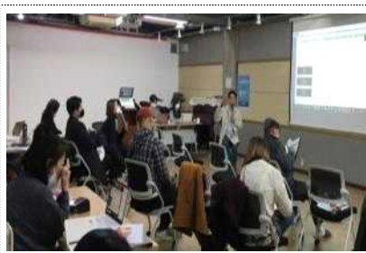
예술청운영준비단 정기 회의