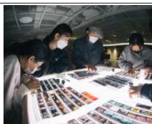
미디어 기반 포지티브 사진 워크숍