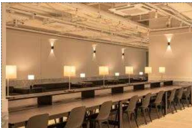
청년예술청 카페형 공유오피스