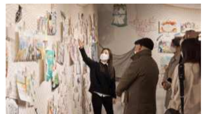
영똥한시리즈 2020_옹레채집展 (올림푸스한국 협력)