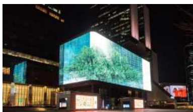
서울미디어아트프로젝트 (아모레퍼시픽 협력)