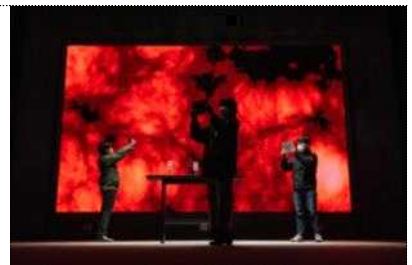
공동운영단 기획사업: 스페이스 랩