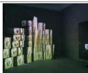
미디어 맵핑 프로젝트