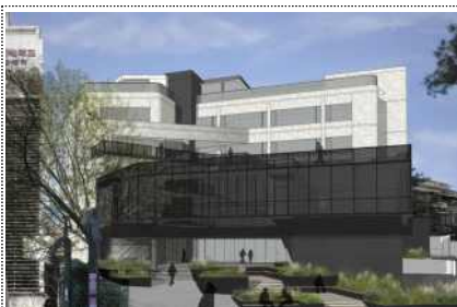
리모델링 후 건물 조감도