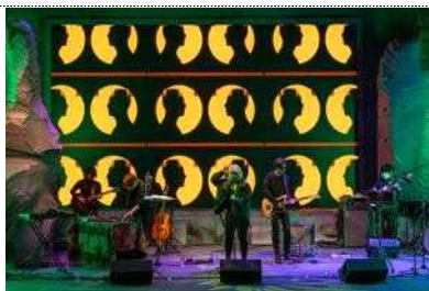
청년예술청 개관프로젝트: 동굴시물레이션