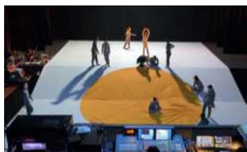
공연 영상제작 위한 공연장 지원 (신한카드 협력)