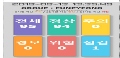
IoT 안전관리솔루션 모니터링