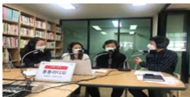
온라인 콘텐츠 제작시스템