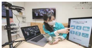
키오스크 사용 원격교육