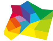
서울특별시 성동구 구청장 정원오