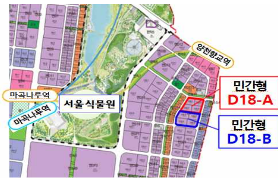
< 위치도 >