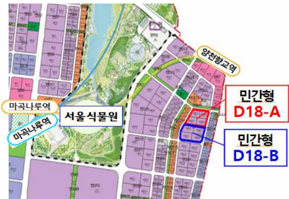
< 위치도 >