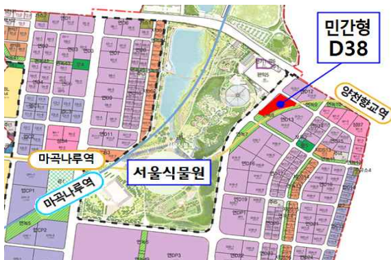
< 위치도 >