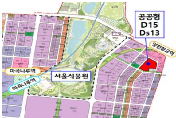
< 위치도 >