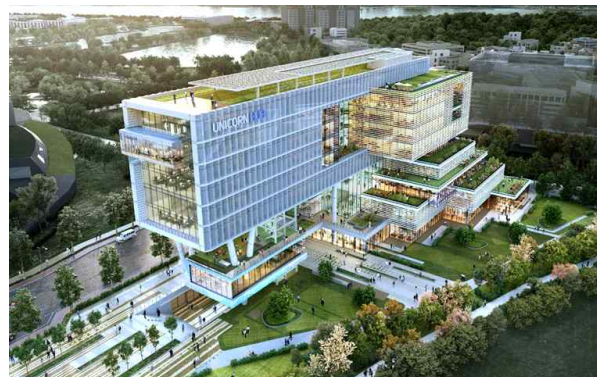
< 공모 선정작 >