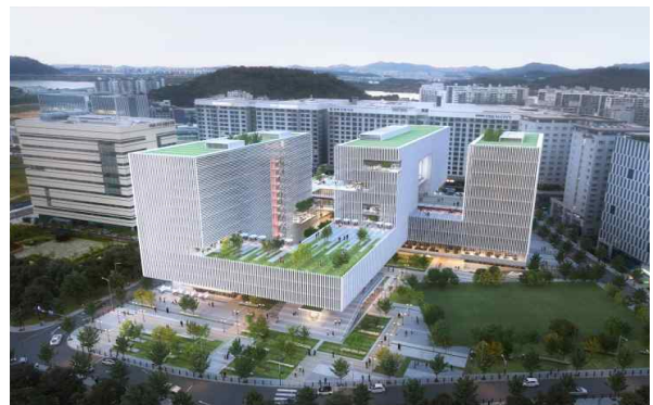
< 현상설계 공모 당선작 >