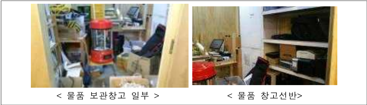
< 물품 보관창고 일부 >