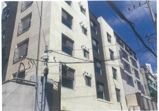
건물 외부 전경