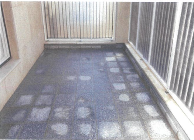
세대 외부 테라스(발코니)