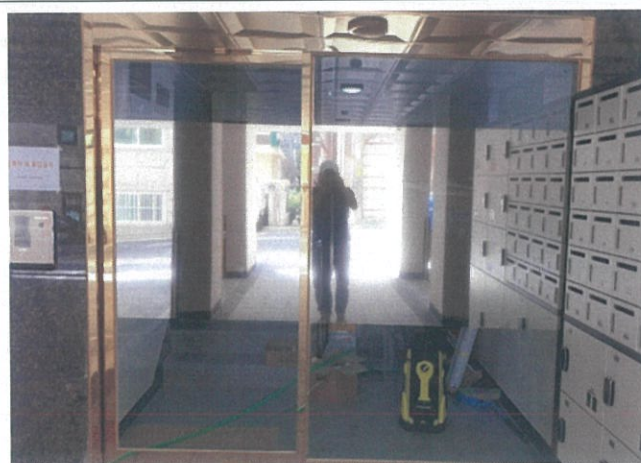
동출입구 현관 전경(외부)