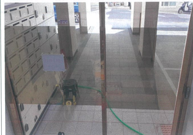
동출입구 현관 전경(내부)