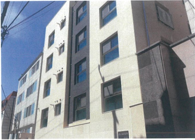
건물 외부 전경