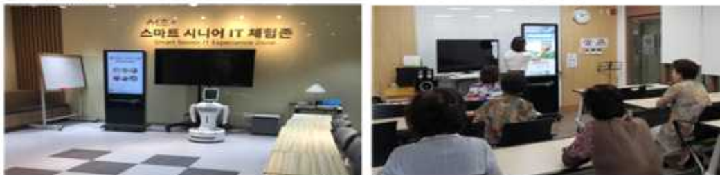
▶ 키오스크 메뉴 : 패스트푸드 카페 음료 주문, 영화티켓 발권, 고속버스 티켓 발권 등