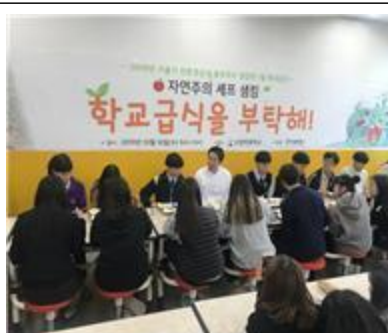
쌈킴 1일 학교급식