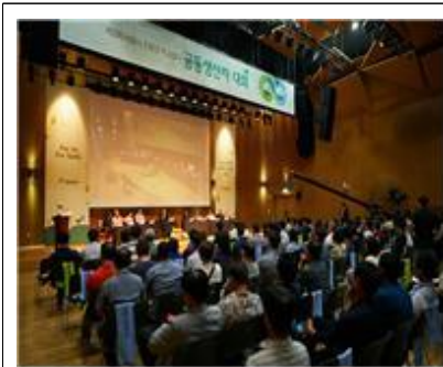
제3회 공동 생산자 대회