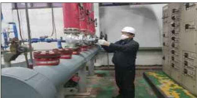
작업 중 마스크 착용