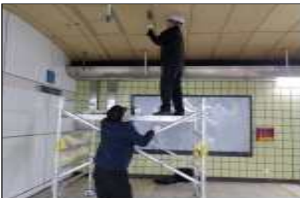
천정형 피난유도등 보수작업