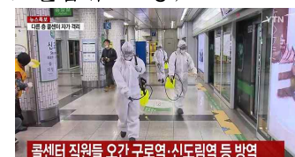
콜센터 직원들 오간 구로역·신도림역 등 방역