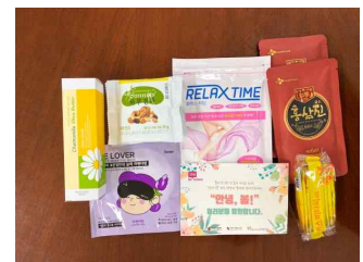
〈 직원 사기진작 키트 〉