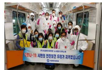
〈 노사 합동 방역·소독 〉