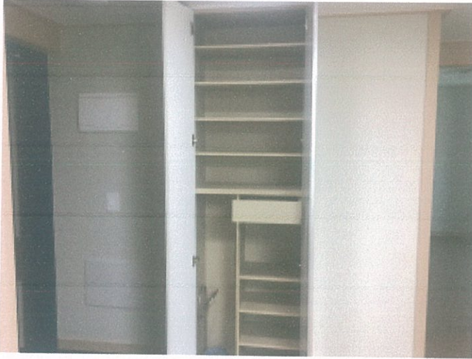
신발장 사진(문 Open)