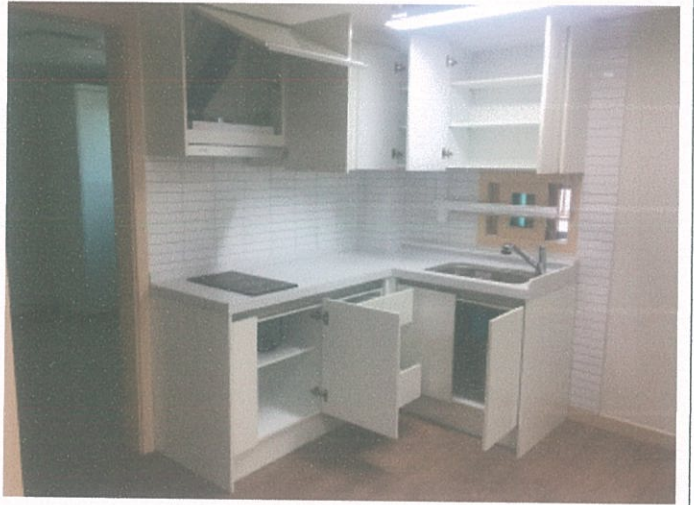
주방가구 사진(문 Open)