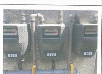
도시가스 계량기 검침(베이크아웃-전)