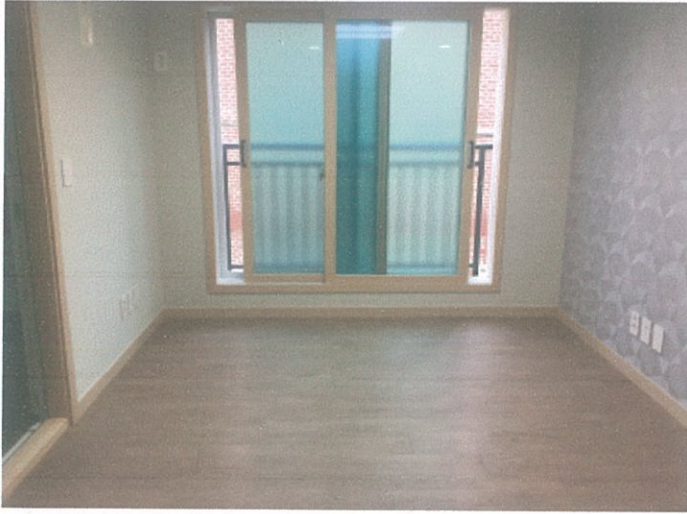
거실 사진 (창호 5cm정도 Open)