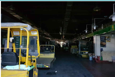
조명 노후 미점등(한국청과)