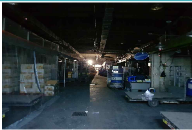
조명 1개소 점등(동화청과)