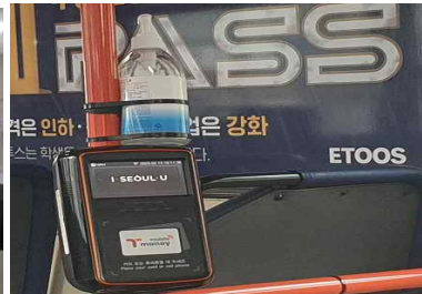
버스 손 소독제 비치