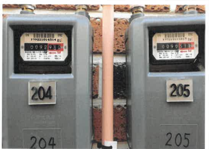
도시가스 계량기 검침(베이크아웃-후)