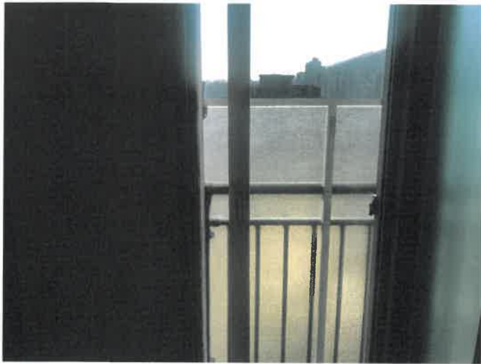
거실 사진 (창호 5cm정도 Open)