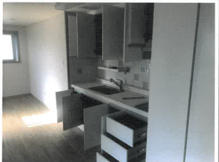
주방가구 사진(문 Open)