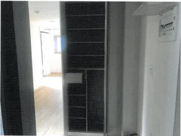
신발장 사진(문 Open)