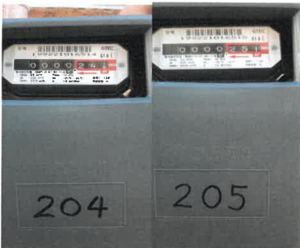
도시가스 계량기 검침(베이크아웃-전)