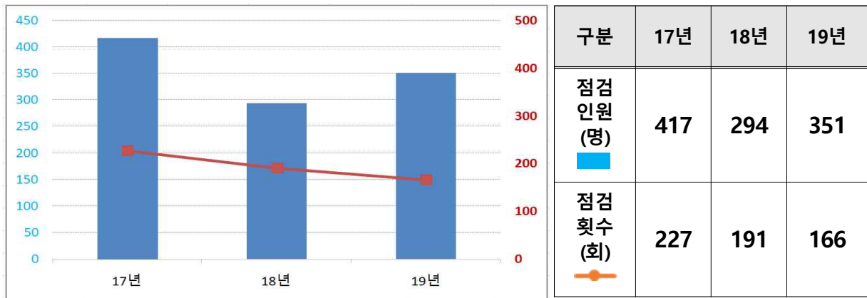
【최근 3년간 공직기강 점검실적】