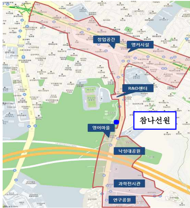
<벤처기업육성촉진지구 추진 지역>