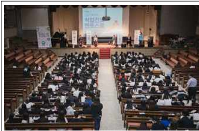
현장 전문가와의 만남(특강)