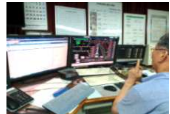
관제사 지적확인환호 이행(지축)