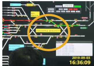
모니터에 구분진로 금지 표기(고덕)